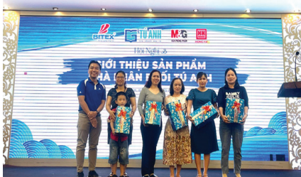
Đại diện BITEK trao quà cho khách hàng, đại lý trúng thưởng trong chương trình