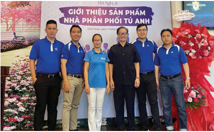
CBNV BITEK và Nhà phân phối Tú Anh tại sự kiện