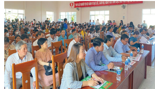
Toàn cảnh chương trình “Tiếp sức đến trường” tại huyện Bắc Bình, tỉnh Bình Thuận

BITEK là nhà tài trợ đã gắn bó với chương trình “Tiếp sức đến trường” của báo Giáo dục & Thời đại trong nhiều năm liền. Thông qua hoạt động tài trợ và đồng hành cùng các chương trình ý nghĩa như Tiếp sức đến trường, BITEK mong muốn đến gần hơn với các em học sinh có hoàn cảnh khó khăn trên cả nước, tiếp thêm niềm tin và nghị lực giúp các em vươn lên trong học tập, vững bước phát triển tương lai.