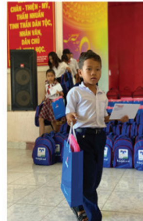
Các em học sinh phấn khởi nhận quà từ chương trình "Tiếp sức đến trường"