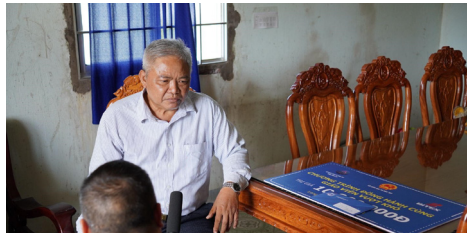
Thầy Nghệ đầy xúc động khi chia sẻ với chương trình về hoàn cảnh của mình