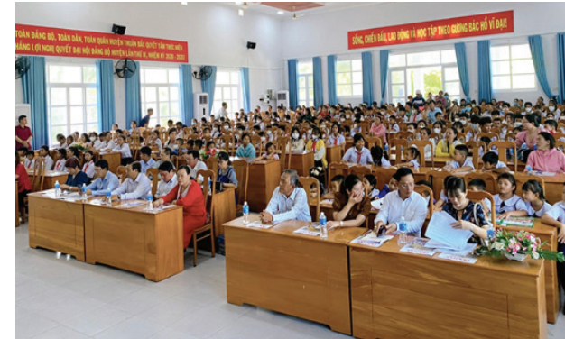
Toàn cảnh buổi lễ trao quà và học bổng của chương trình “Tiếp sức tới trường” tại huyện Thuận Bắc, tỉnh Ninh Thuận

Vừa qua, BITEK đã phối hợp cùng báo Giáo dục & Thời đại triển khai chương trình “Tiếp sức đến trường” tại tỉnh Ninh Thuận và Bình Thuận. Theo đó, BITEK đã trao tặng tổng cộng là 400 phần quà cho các em học sinh có hoàn cảnh khó khăn đạt thành tích cao trong học tập.