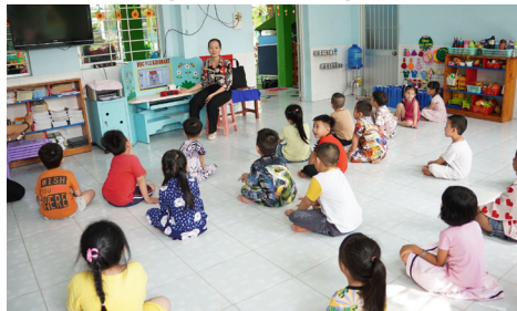
Ngoài hỗ trợ các giáo viên có hoàn cảnh khó khăn, đại diện công ty BITEK đến gặp gỡ và trao quà cho các em học sinh